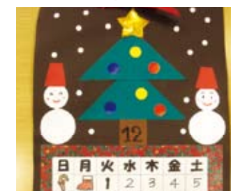
カレンダー(12月クリスマス)