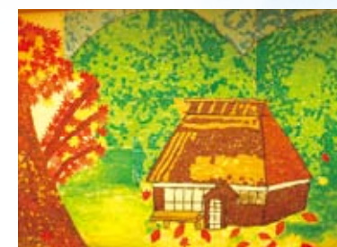
ちぎり絵(共同制作)