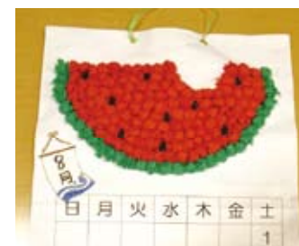
カレンダー(8月スイカ)