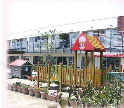
子育てセンターなかぜ

〒434-0003 浜松市浜北区新原2669 TEL053-580-1011 FAX053-580-1012 定員176名 昭和50年4月1日設立