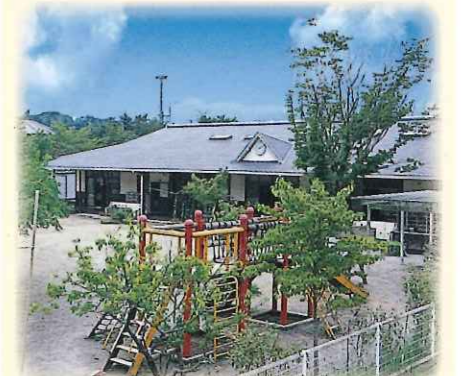
子育てセンターやまびこ

〒431-3305 浜松市天竜区大谷111-1 TEL053-922-0170 FAX053-922-0171 定員66名 昭和53年4月1日設立