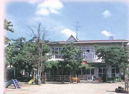
子育てセンターこまつ

〒434-0042 浜松市浜北区小松3221 TEL053-584-0170 FAX053-584-0171 定員143名 昭和44年4月1日設立