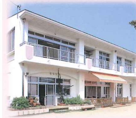
子育てセンターきぶね

〒434-0042 浜松市浜北区小松3221 TEL053-584-0170 FAX053-584-0171 定員143名 昭和44年4月1日設立