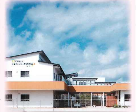
子育てセンターかきのみ

〒434-0012 浜松市浜北区中瀬73 TEL053-584-0174 FAX053-585-3223 定員146名 昭和51年4月1日設立