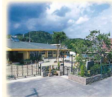
子育てセンターすぎのこ

〒434-0016 浜松市浜北区根堅2596-1 TEL053-545-6380 FAX053-545-7552 定員86名 平成29年4月1日設立