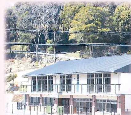
子育てセンターみゅうのおか

〒434-0012 浜松市浜北区中瀬2308 TEL053-545-3870 FAX053-545-6880 定員146名 平成28年4月1日設立