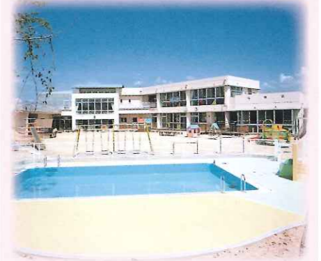
子育てセンターしばもと

〒434-0038 浜松市浜北区貴布祢2668 TEL053-584-0172 FAX053-584-0173 定員153名 昭和45年4月1日設立