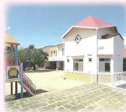
子育てセンターしんばら

〒434-0015 浜松市浜北区於呂3087-2 TEL053-580-0050 FAX053-580-0051 定員146名 昭和46年4月1日設立