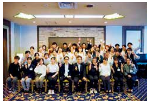
会の終了間際まで盛り上がっていました～！