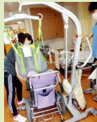
床走行リフト使用中の様子

※その他、記録システムやとろみサーバー、寝返り支援ベッド、泡シャワーなどの入浴機器も導入されています。