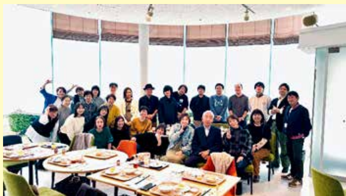
富士宮・静岡・藤枝「ホテルアソシア静岡 パーゴラ」