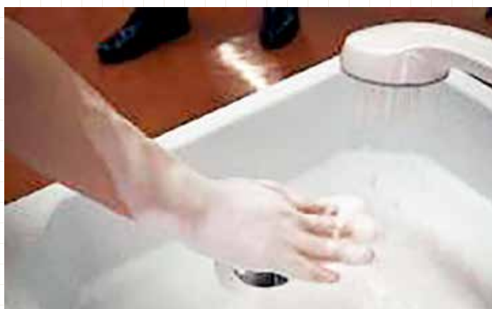
泡シャワー体験の様子