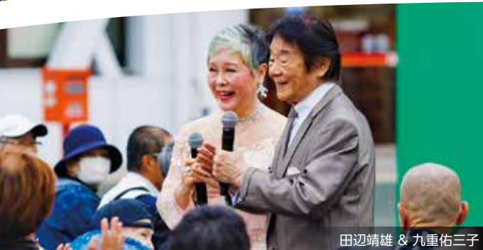
田辺靖雄 & 九重佑三子