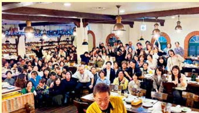
掛川・袋井・磐田「マイン・シュロス」