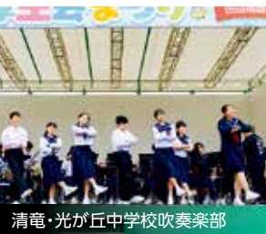
清竜・光が丘中学校吹奏楽部