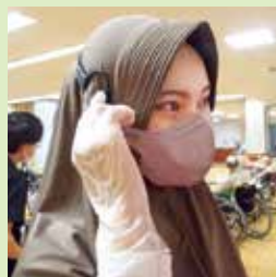
インカム使用の様子