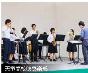
天竜高校吹奏楽部