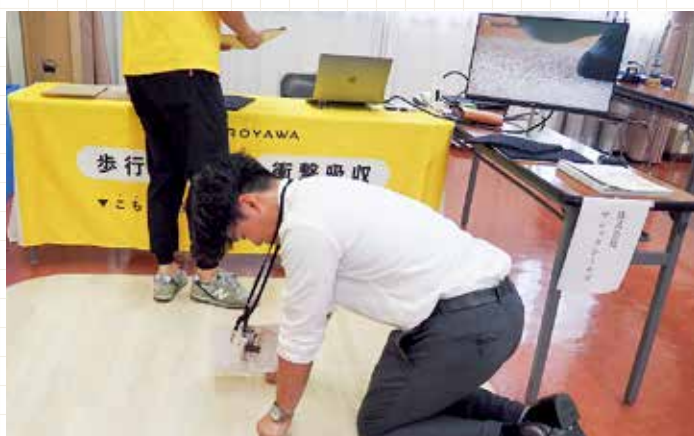
衝撃吸収マットの感触確認