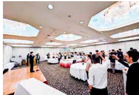
村瀬常務理事のあいさつ、みんなで乾杯！