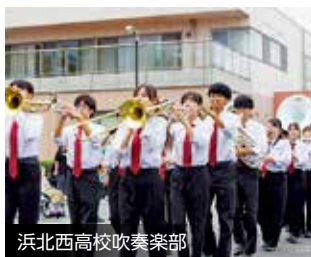
浜北西高校吹奏楽部