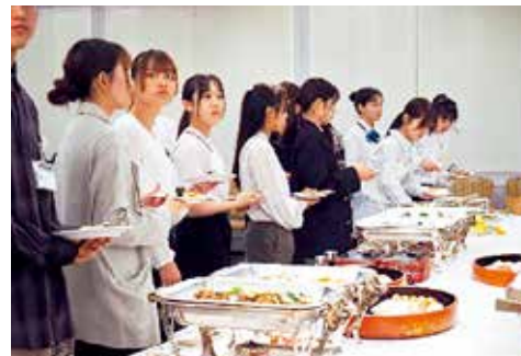
食事は立食形式のビュッフェスタイルにて