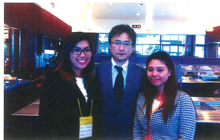
当法人職員と候補者